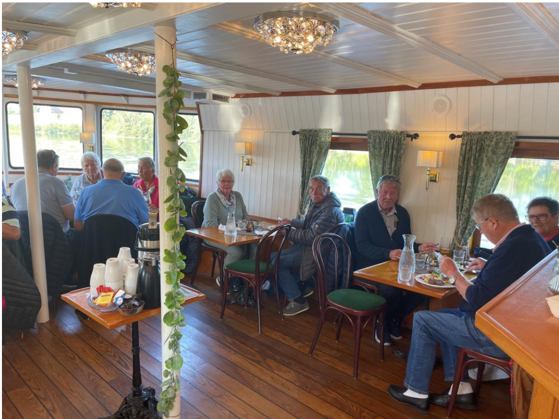
God tradisjonskost om bord på båten