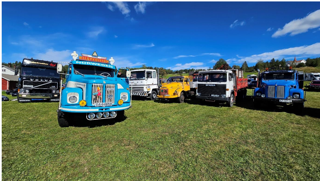
.....og atter lastebiler