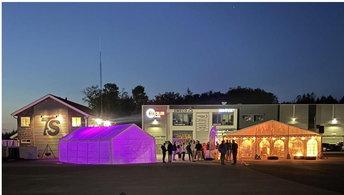
TS Vestfold sin 80 års fest i full gang.

I 80 år har Transportsentralen Vestfold tilbudt et bredt spekter av transporttjenester. Jubileumsfesten i Sandefjord ble en trivelig markering.