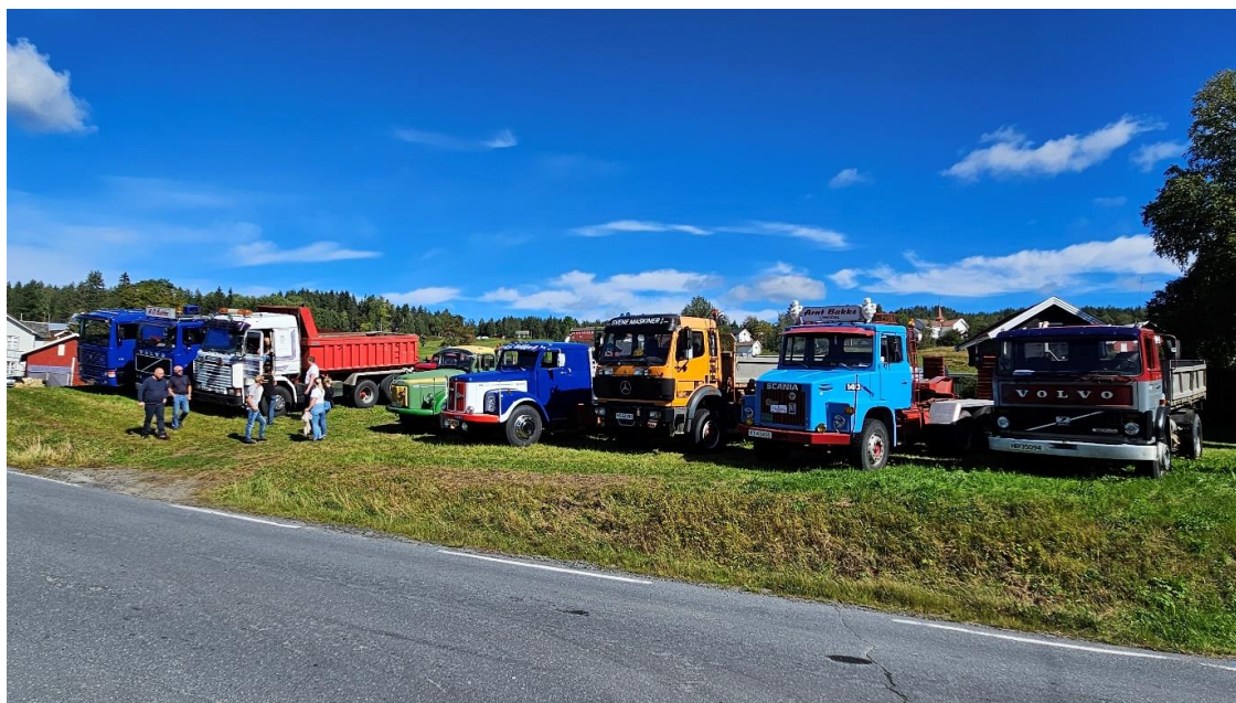
Lastebiler fra Arnt Bakke sin egen firmadrift

Sliter du med tunge tanker etter ulykke? Kontakt Kollegahjelpen!