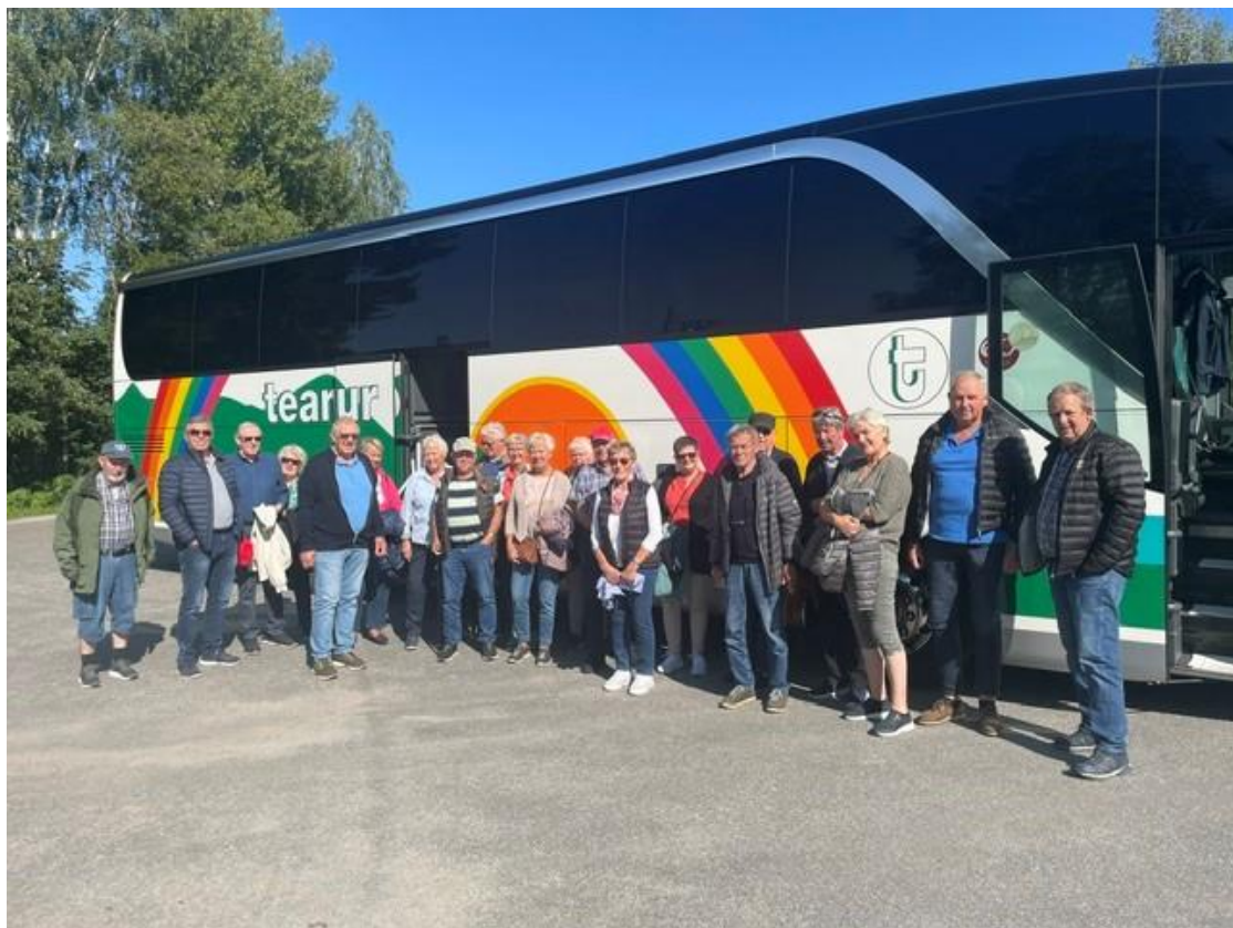
Glad turgjeng utenfor bussen fra Grimnes Buss