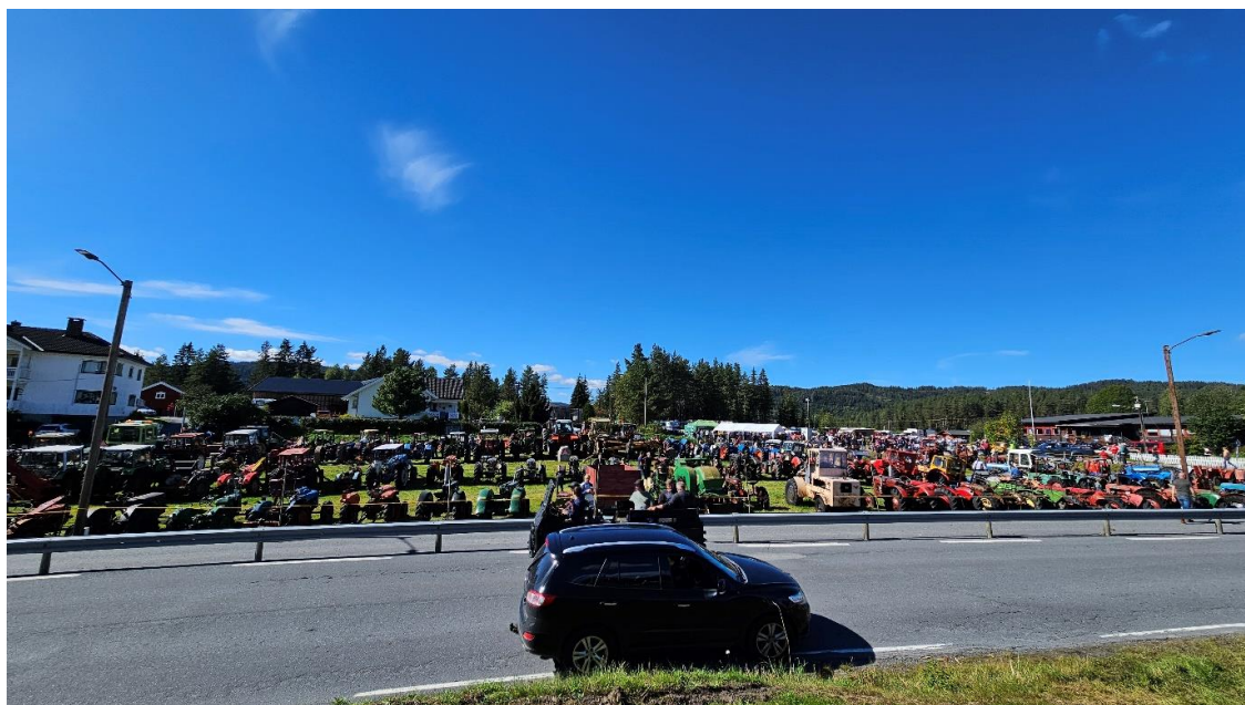
Bakkejordet var et imponerende skue. Ved innkjøringen til gården står et skilt med «Villmarken Auto», en gammel traktor og bensinpumpe fra «BP»