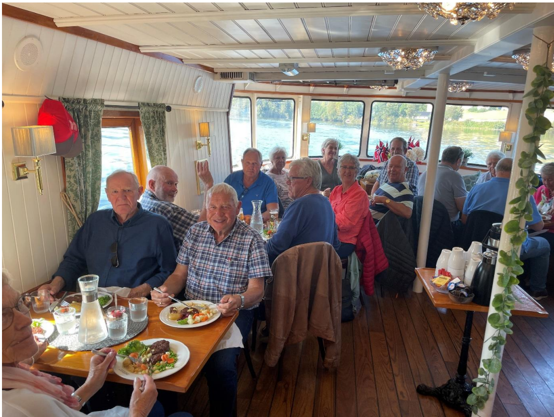
I kanalbåten Victoria ble det også servert middag