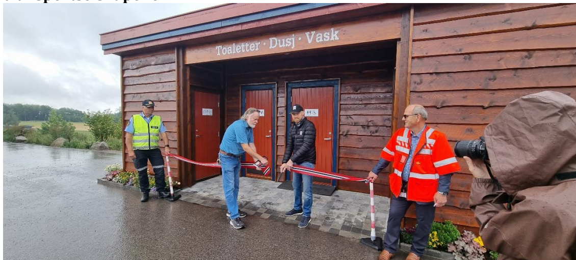
I fjor ble snoren klippet for åpning av nytt servicebygg på Furulund. Nå skal det skje mer

NLF Vestfold vil 5. oktober kl. 10:00 til 16:00 stå som arrangør av et felles høsttreff for region 3. Det vil foregå på Furulund døgnhvileplass med ulike aktiviteter og spennende gjester. Sett av dagen og ta med de ansatte i transportselskapene.