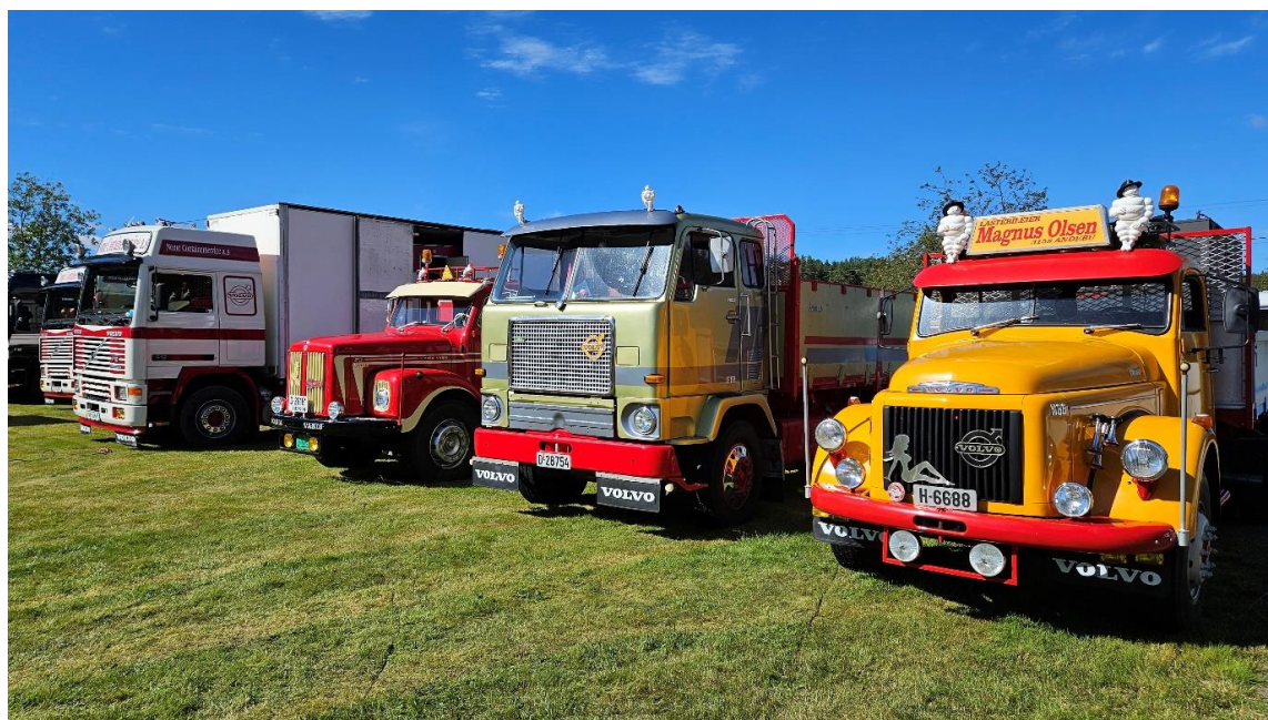
Gamle lastebiler på rekke og rad